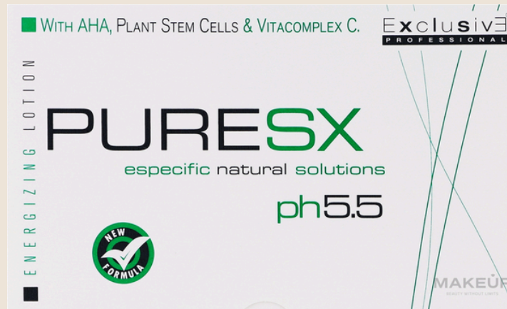
Deep Energizing Lotion

Loción para la prevención de la caída del cabello. – Rica en A.H.A., células madres de origen vegetal y vitacomplex C.