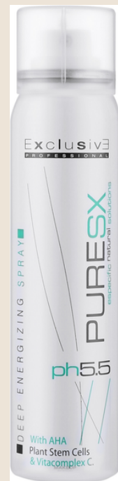
Deep Energizing Spray

Loción para la prevención de la caída del cabello.